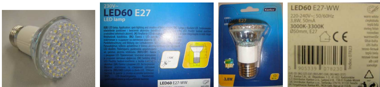
Fot. 5 Badana lampa LED i jej etykiety

Do podstawowych zalet lamp diodowych, w porównaniu z lampami żarowymi, należy znacznie większa trwałość, szerszy zakres napięć roboczych, większa sprawność, znacznie mniejsze nagrzewanie, brak zależności temperatury barwowej światła od napięcia zasilającego, a w przypadku kontrolerek, dodatkowo możliwość uzyskania dowolnego koloru świecenia bez użycia barwnych filtrów. Do wad należą: wysoka cena (rekompensowana przez dużo dłuższą żywotność), ograniczony kąt świecenia oraz niekompatybilność z tradycyjnymi ściemniaczami dla żarówek.