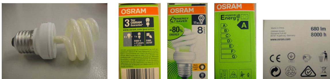
Fot. 5 Badana świetlówka kompaktowa i jej etykiety

Świetlówka kompaktowa badana w ćwiczeniu należy do pierwszej grupy.