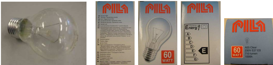
Fot. 1 Badana żarówka i jej etykiety

Światło uzyskiwane z żarówek jest światłem zbliżonym do słonecznego i cechuje się dobrym wskaźnikiem oddawania barw oglądanych w tym świetle przedmiotów, świeci cały czas jednakowo, nie powodując efektu stroboskopowego. Widmo światła emitowanego przez żarówkę jest ciągłe, o niższej temperaturze barwowej (bardziej żółte) niż słoneczne. Temperatura barwowa światła emitowanego przez żarówkę wynosi ok. 2700 K. Wadą żarówek jest ich mała skuteczność świetlna, wynosząca zazwyczaj około 12 (od 8 do 16) lumenów/wat (niektóre mają sprawność poniżej 6 lumenów/wat), a także niska trwałość. Żarówka wykorzystuje ok. 5% energii na światło widzialne, a reszta energii jest tracona w emisji ciepła.