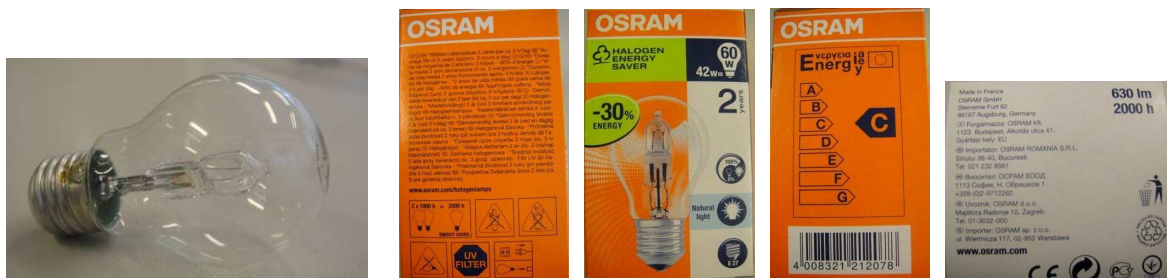
Fot. 2 Badana żarówka halogenowa i jej etykiety

Jest to żarówka z żarnikiem wolframowym, wypełniona gazem szlachetnym z niewielką ilością halogenu (czyli fluorowca, np. jodu), który regeneruje żarnik, przeciwdziałając jego rozpylaniu, a tym samym ciemnieniu bańki od strony wewnętrznej. Halogen tworzy związek chemiczny z wolframem (parami wolframu w bańce i na ściankach bańki). Związek ten krąży wraz z gazem w bańce w temperaturze panującej blisko żarnika, a następnie rozpada się na wolfram i fluorowec. W rezultacie tej reakcji następuje przenoszenie cząstek wyparowanego wolframu z bańki na żarnik. Proces ten nazywa się halogenowym cyklem regeneracyjnym. Występowanie tego cyklu pozwala zwiększyć temperaturę żarnika do około 3200 K, zatem żarówki halogenowe cechują się wyższymi skutecznościami świetlnymi w porównaniu do zwykłych lamp żarowych (do 18 lumenów/wat).