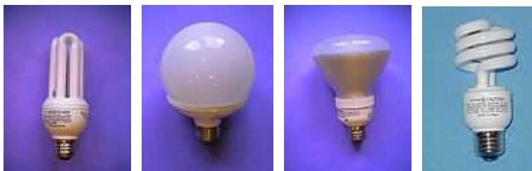
Fot. 4 Przykłady świetlówek ze zintegrowanym układem zapłonowym

Zaletą świetlówek z zewnętrznym układem zapłonowym jest niższa cena spowodowana tym, iż w jej skład nie wchodzi cena tego układu. Są one także bardziej przyjazne środowisku, ponieważ nie marnuje się układów zapłonowych, jak to ma miejsce w przypadku zużytych świetlówek pierwszego rodzaju. Produkowane są zarówno świetlówki całkowicie pozbawione jakichkolwiek dodatkowych urządzeń jak i z wbudowanym samym zapłonikiem. Takie modele wymagają opraw wyposażonych jedynie w statecznik.